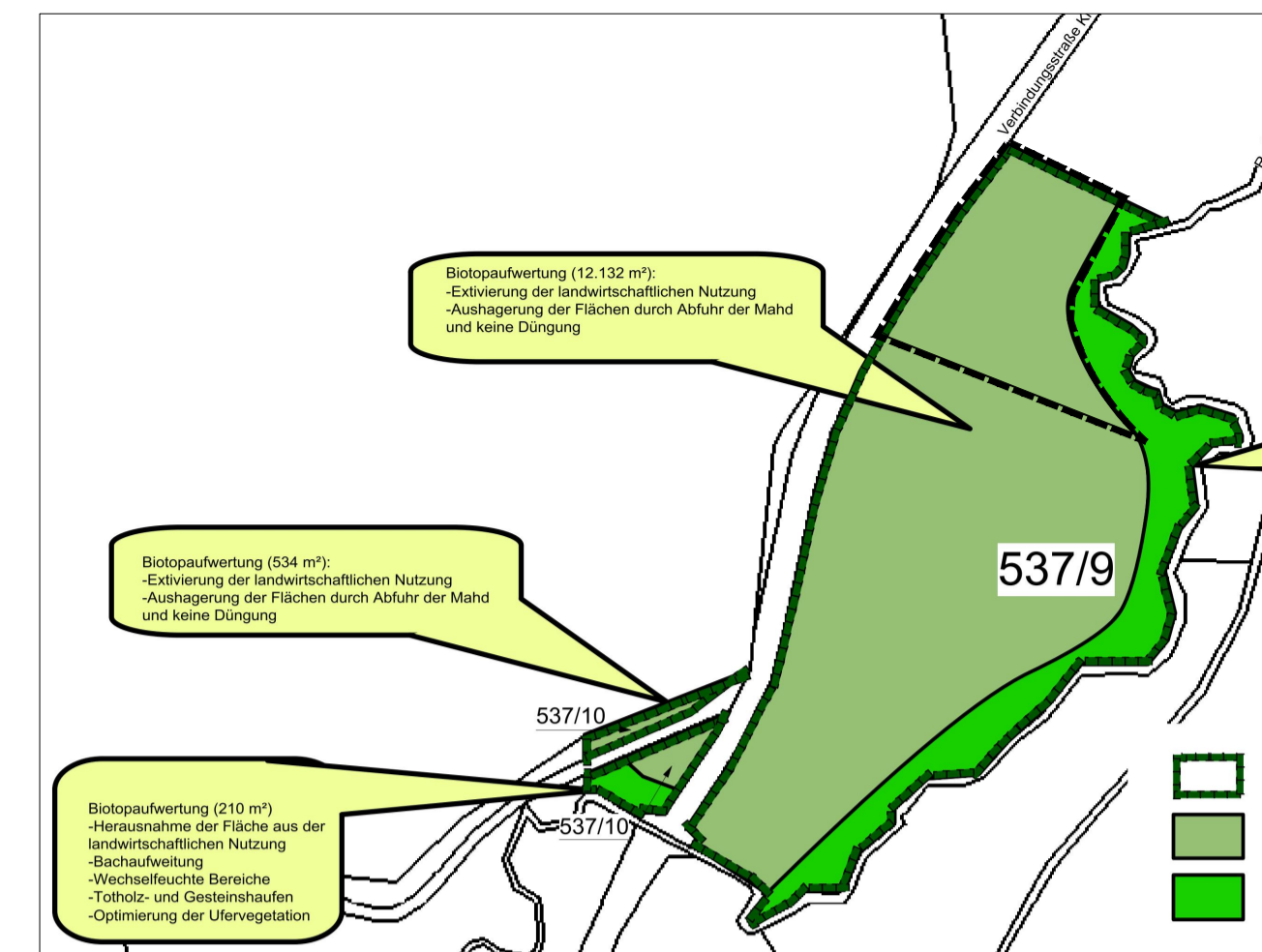
Flächen aus dem Ökoko Kraftisried, M 1:2000, FL. 537/9, Teilfläche: 2.700 m²