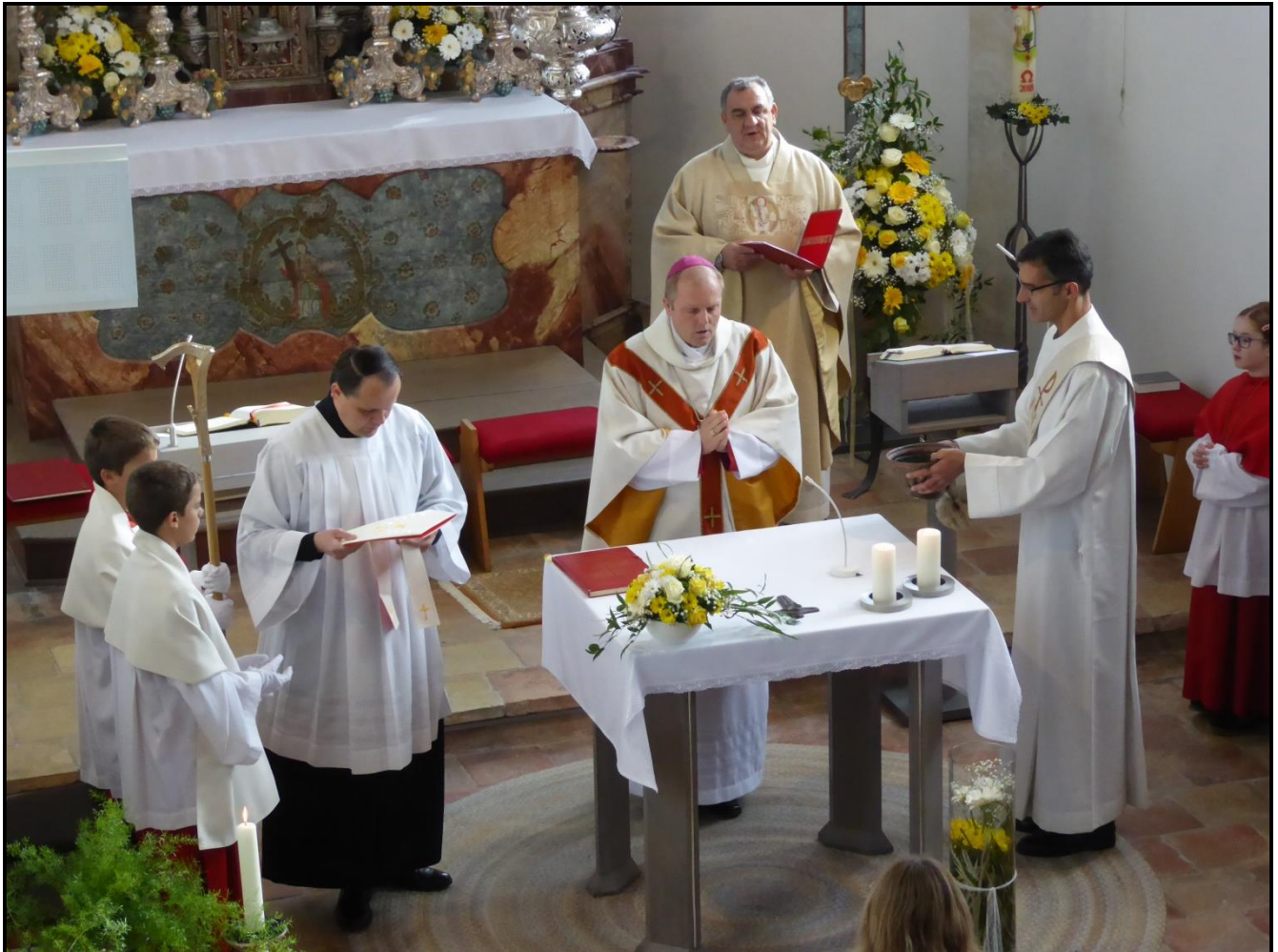
Pontifikalamt mit Weihbischof Florian Wörner