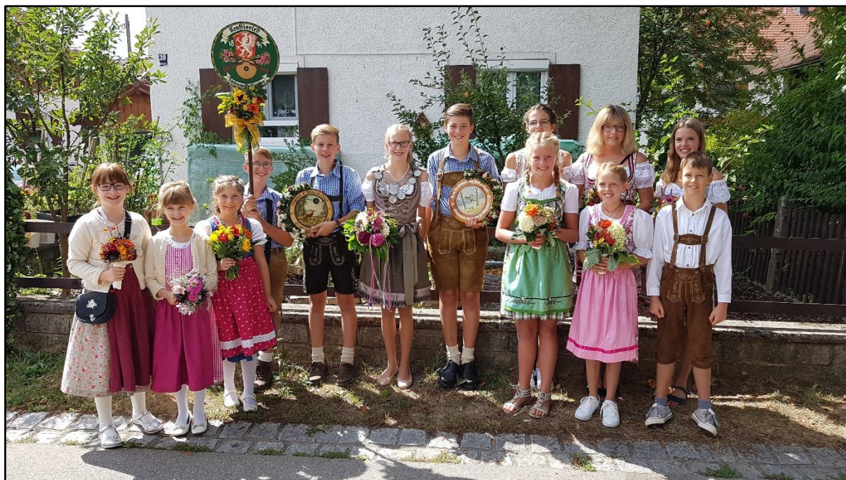
Die Schützenjugend beim Umzug zum Freischießen in Obergünzburg 2018